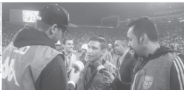
Em entrevista após a decisão de 2017 entre Corinthians e Ponte Preta

Campeonato Brasileiro da Série A1 feminino, pedi para a comissão de arbitragem da CBF me colocar para pegar ritmo de jogo. Palmeiras e São Paulo, em Vinhedo”.