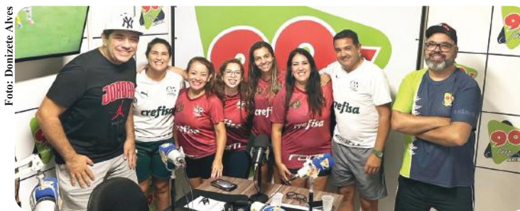
As atletas do Palmeiras Atibaia

Fábio Silvério - Especial para o Atibaia Hoje