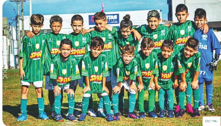
Os meninos do Sub9

No dia 13 de abril, pela Copa BBS Sub9, o Palmeiras Atibaia se classificou para a final ao empatar por 1 a 1 com o Legionários de Bragança Paulista.