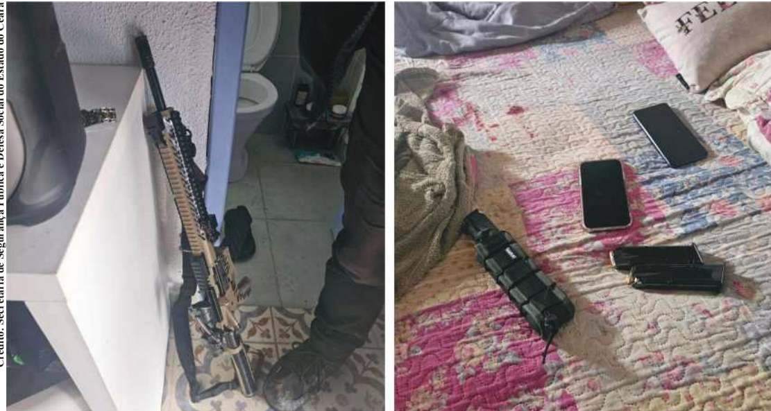
Homem era procurado por homicídios contra advogado e personal trainer, ambos no estado cearense

O chefe de um grupo criminoso do Nordeste morreu na quarta-feira (11 de fevereiro), em Atibaia, após confronto com os Policiais Civis do Ceará e de São Paulo. Foram apreendidos ainda um fuzil, pistola e munições.