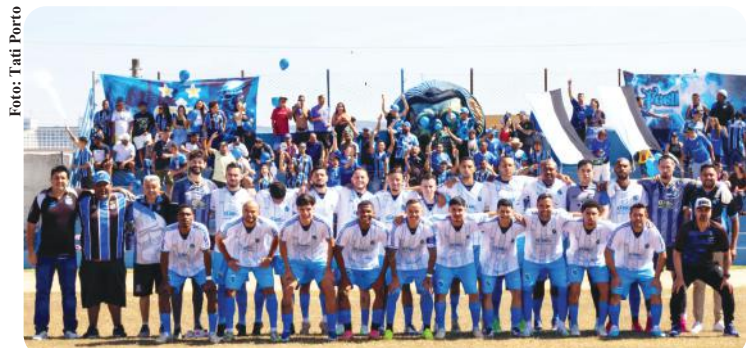
O Unidos do Tanque, atual campeão e que possui 2 conquistas

A disputa começa em 15 de maio e contará com 13 equipes divididas em 3 grupos. O União dos Mineiros, que subiu da 2ª Divisão e disputaria pela primeira vez a 1ª Divisão, pediu afastamento