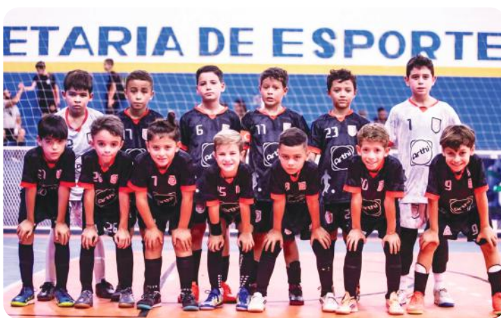
O Sub9 de Atibaia

A pré-temporada das turmas de competição do Atibaia Futsal começou dia 12 de fevereiro e foram realizadas seletivas nos dias 19, 21 e 23 de janeiro; para todas as categorias do Sub7 ao Sub18. No dia 7 de fevereiro, o time estreou na 4ª Copa Craques do Amanhã, em Perdões/SP: Sub9: Atibaia 6 x 0 Borgo Mozzano (Jundiá), Sub12: Atibaia 13 x 4 Borgo Mozzano, Sub13: Atibaia 7 x 3 Borgo Mozzano e Sub14: Atibaia 3 x 3 Borgo Mozzano.