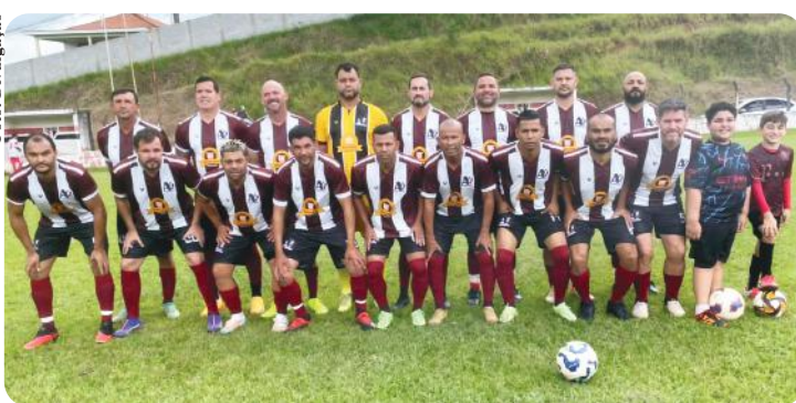
O Az de Ouro

Fábio Silvério - Especial para o Atibaia Hoje